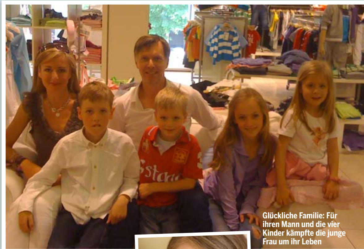
Glückliche Familie: Für ihren Mann und die vier Kinder kämpfte die junge Frau um ihr Leben

Es ist kurz vor Weihnachten 2004. Fast scheint es so, als sei der Krebs im Gebärmutterhals