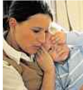
Manchmal reicht trösten, wenn das Kind verletzt ist.

DÖHLAU Schock für die Mitarbeiterinnen einer Bank in Döhlau (Kreis Hof): Am Freitagabend wurde die Filiale von einem Unbekannten überfallen. Der Mann bedrohte die beiden Frauen mit einer Pistole und zwang sie, den Tresor zu öffnen. Er klappte einen fünfstelligen Betrag, dann sperrte er die Frauen in einen Nebenraum und flüchtete. Die Polizei sucht nach ihm.